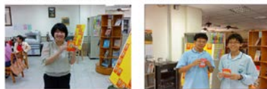
圖書資訊科辦理校園新書推薦抽獎活動，鼓勵老師們為學校推薦好書！