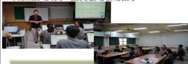
英文、國文領域老師正在認真上運用媒體教學課程