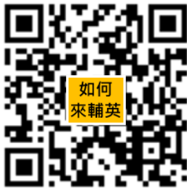
輔英科技大學交通資訊 (大眾運輸／自行開車)