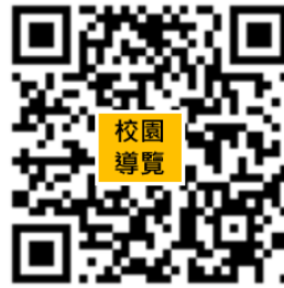
輔英科技大學校園導覽圖